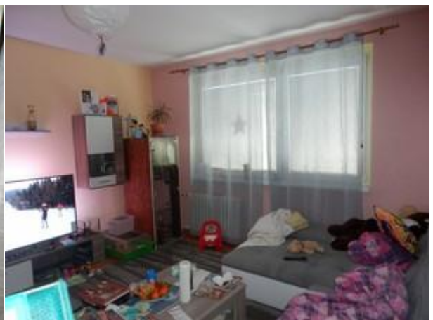
Pokoj s kuch. koutem