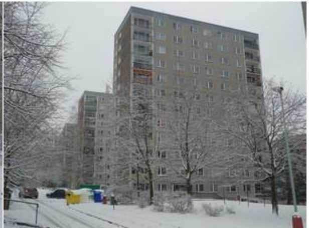
Budova č.p. 3210