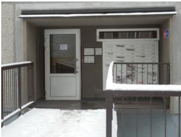
Vstup do č.p. 3210